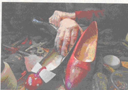
CURSOS. PARTICIPAN DESDE CARPINTEROS A ORGANIZADORES DE EVENTOS.

arrollo local. Para lograrlo, darán capacitación constante y cursos intensivos. Una especie de tutor acompañará a los emprendedores, que serán sometidos a un proceso de selección. Quedarán 250, pero 100 gozarán del beneficio de un seguimiento continuo.