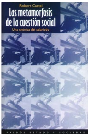
Las Metamorfosis de la Cuestión Social Editorial Paidós

En la actualidad la cuestión social parte del centro de producción y distribución de las riquezas, es decir de la empresa, y atraviesa el reino omnívoro del mercado. Por lo tanto, se traduce en la erosión de las protecciones y la cada vez mayor vulnerabilidad de las condiciones del trabajador. La onda expansiva producida por el derrumbe de la sociedad salarial conmueve la totalidad de la estructura social. ¿Cuáles son los recursos que deben mobilizarse para salvar a los naufragos de la sociedad salarial?